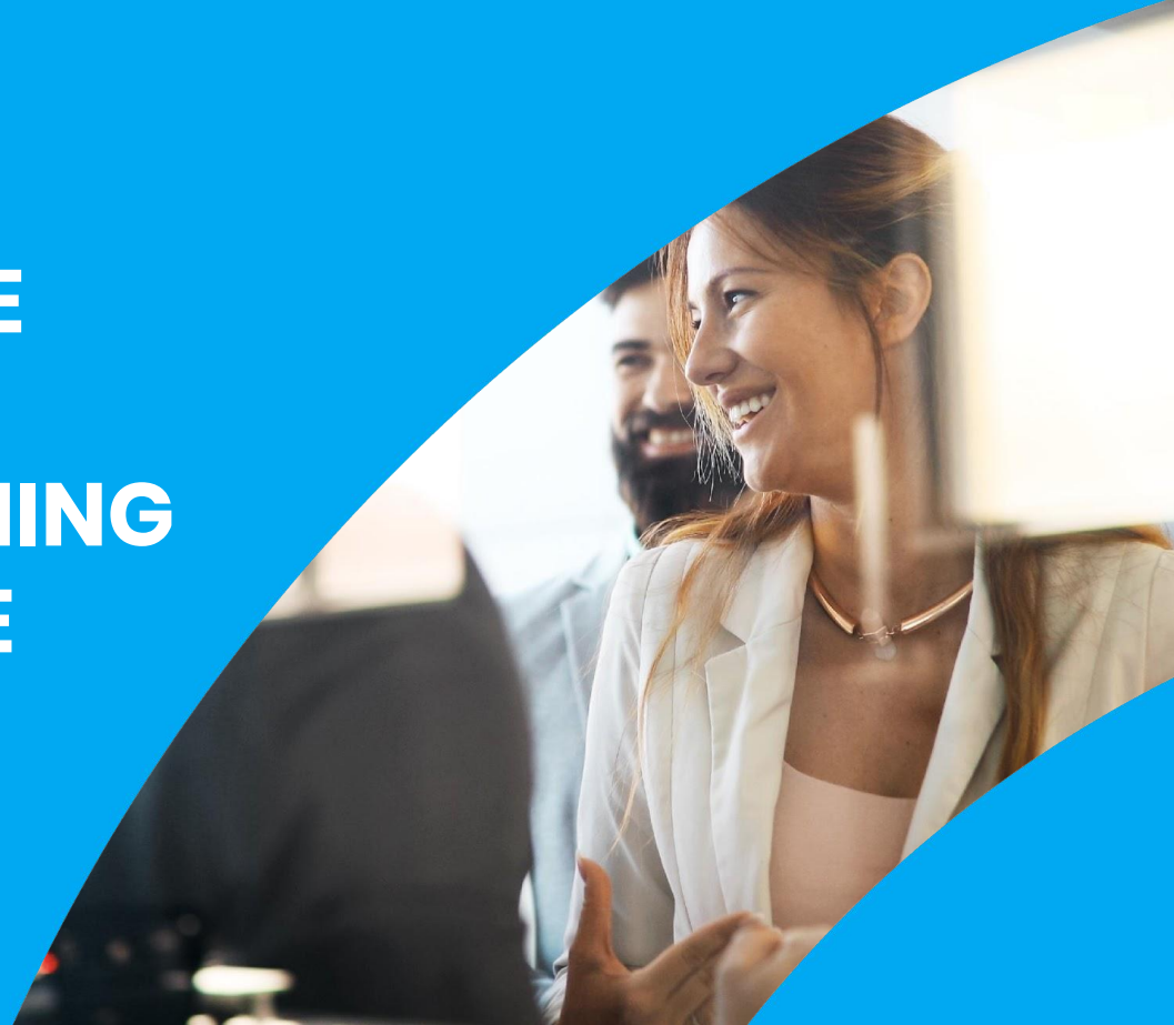
TABLE RONDE LE MOBILE LEARNING SUR-MESURE